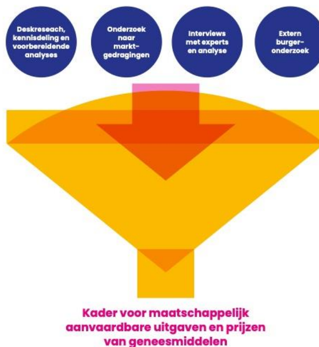
Figuur 2: Deelresultaten vormen input voor het op te stellen kader

De eigen analyses en de drie deelresultaten worden door de programmapartijen gebruikt voor het opstellen van het advies over het kader voor maatschappelijk aanvaardbare prijzen van en uitgaven aan geneesmiddelen. Dat zal bestaan uit 'elementen', een meetlat en een weging. Elementen zijn de grootheden (factoren) die een rol spelen in de besluitvorming. De meetlat bestaat uit een of meerdere kwantitatieve normen waartegen de elementen, voor zover mogelijk, kunnen worden afgezet. De weging is ten slotte een integrale beschouwing die inzicht geeft in wat maatschappelijk aanvaardbare uitgaven aan en prijzen van geneesmiddelen zijn.